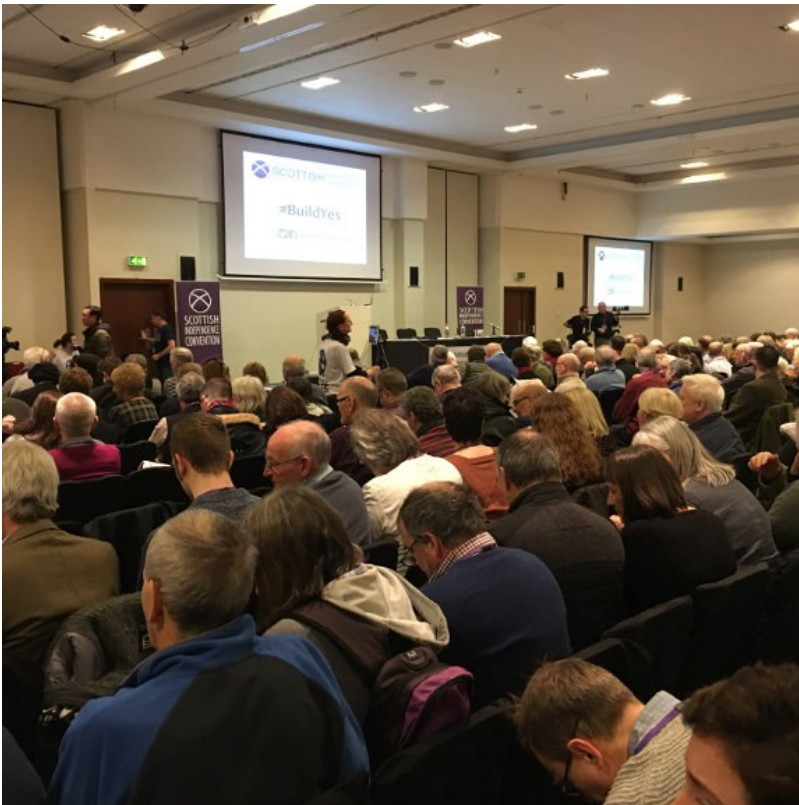
Op weg naar "indyref 2"

Het ziet er dus naar uit dat de Yes2-campagne gelanceerd is, een campagne die sommige verenigingen en partijen voor een aanzienlijk stuk opgebouwd zou kunnen worden rond het thema van de Brexit. In het publiek waren eveneens deelnemers aanwezig die voor een Brexit gestemd hebben, en dit thema als een 'minste kwaad' beschouwen en desnoods mee campagne willen voeren vóór een EU-campagne, indien het merendeel van de Schotten dit wensen. In het belang van een zo breed mogelijke burgermobilisatie kan het evenwel positief genoemd worden dat de SNP geen monopolie meer heeft over dit debat en dat dit onderwerp nu aan de brede Schotse samenleving toebehoort, die zijn eigen weg kan vormen.